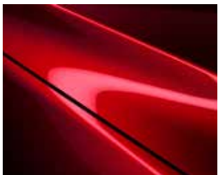
אדום עשיר נוצץ (46V)*