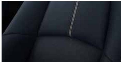
בד שחור משולב כחול ברמת גימור Elegant