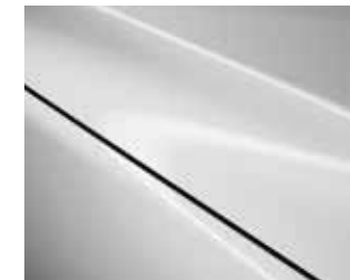
לבן פנינה (25D)