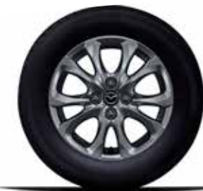
חישוק 15" סגסוגת קלה ברמת גימור Dynamic