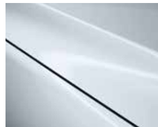
לבן קרמי (47A)