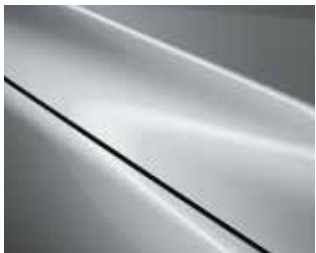
כסף סוניק (45P)