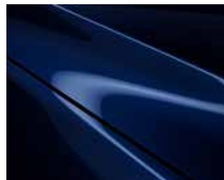
כחול קריסטל כהה (42M)