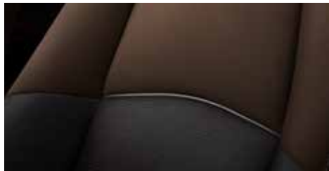
בד שחור משולב חום ברמת גימור Dynamic