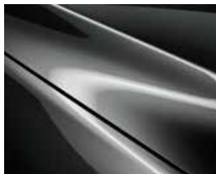
אפור עשיר (46G)*