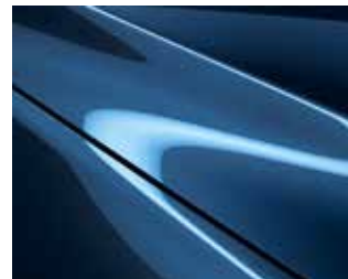
כחול נצחי (45B)