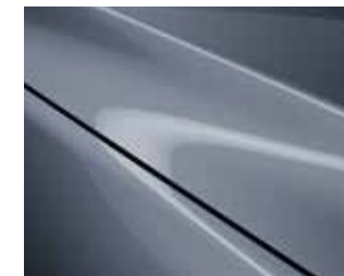
כחול מתכתי (47C)