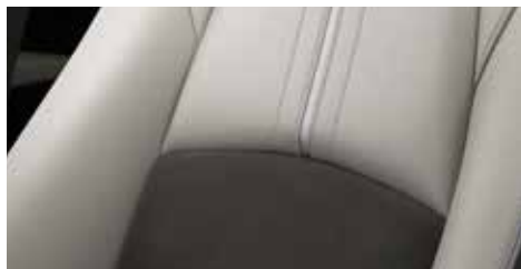
עור לבן Pure White בשילוב סווייד אפור ברמת גימור Pure White