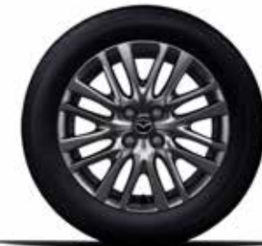
חישוק 16" סגסוגת קלה ברמות גימור Pure White ו-Elegant

לתשומת ליבך! דוגמאות הצבעים, הריפודים והחישוקים בעלון זה מוצגות לשם המחשה בלבד. בשל מגבלות הדפוס, תכנה סטיות מהצבעים החומרים בפועל. היצע הצבעים כפוף לשינויים אפשריים על פי מדיניות היצרן ולמגבלות המלאי. פנה לנציג מכירות לקבלת מידע עדכני.