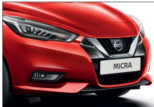
אדום שני מטאלי NBDK