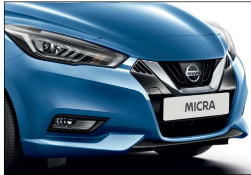
כחול אוקיינוס מטאלי RQGK