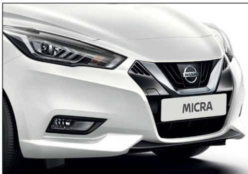
לבן פנינה מטאלי QNCK