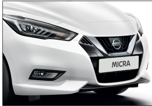
לבן צחור ZY2K