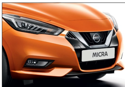
כתום ענבר מטאלי EBFK