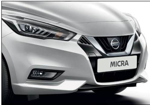
כסף מטאלי ZBDK