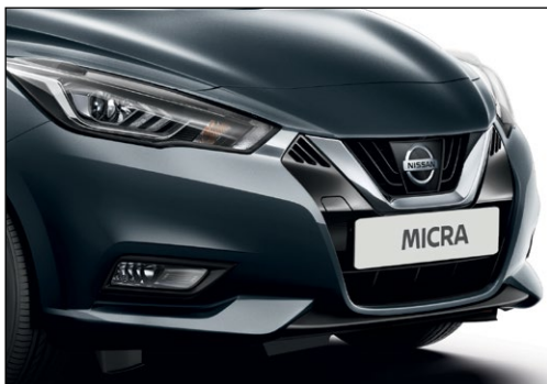
אפור כחול מטאלי KPNK