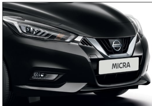
שחור מטאלי GNEK