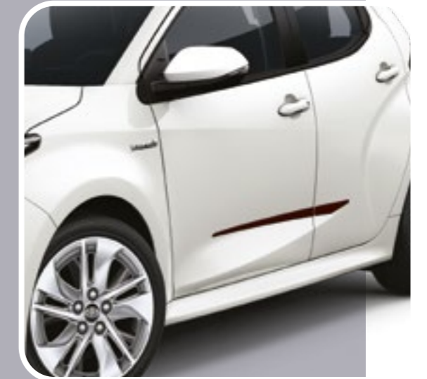
סט פסי הגנה שחורים לדלתות