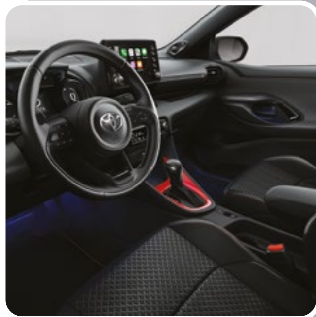
קישוט קונסולה מרכזית בצבע אדום