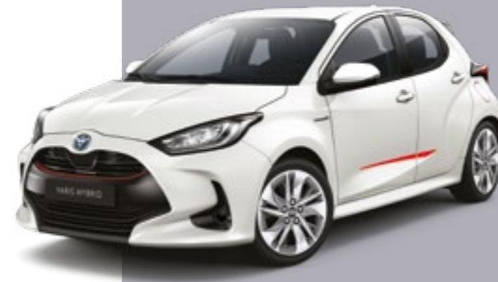
סט פסי קישוט בצבע אדום