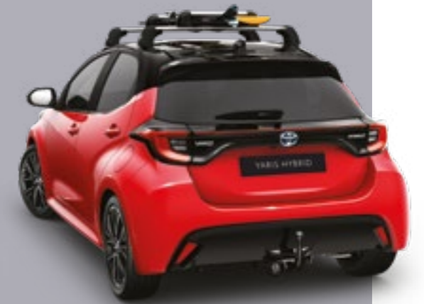
מוטות רוחב - סט של שניים