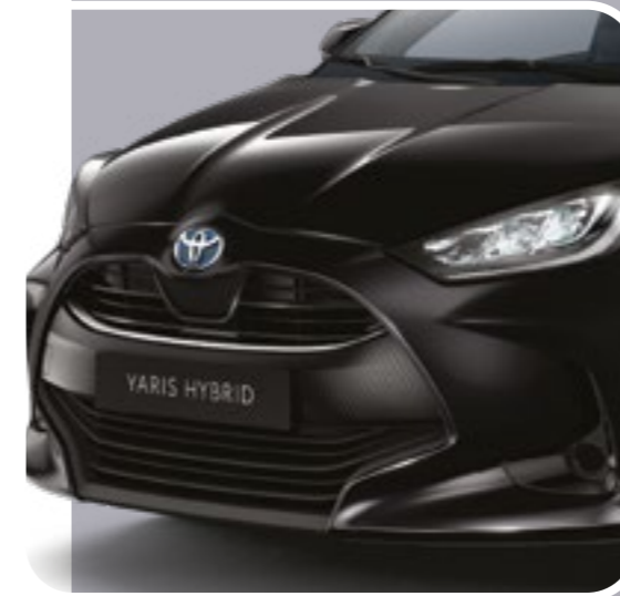
קישוט פגוש קדמי בצבע ניקל