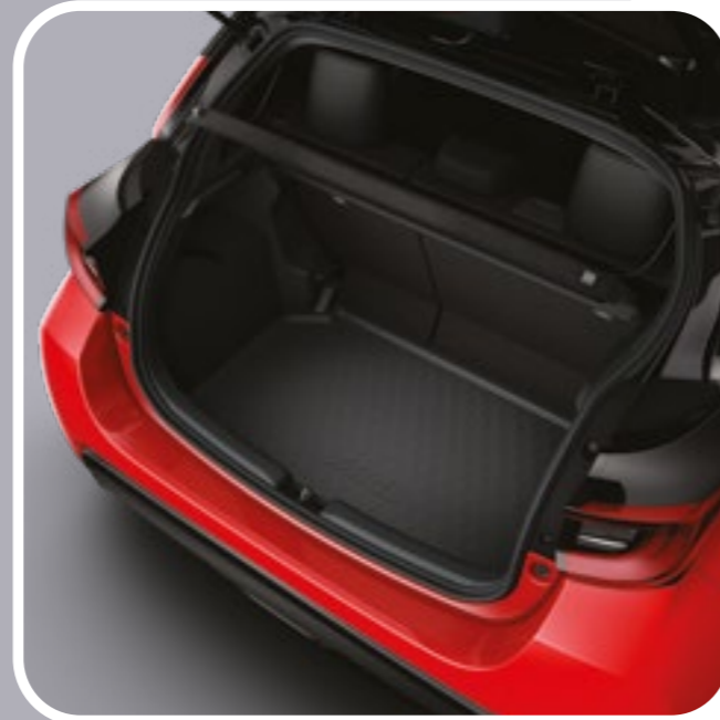
אמבטיה לתא המטען