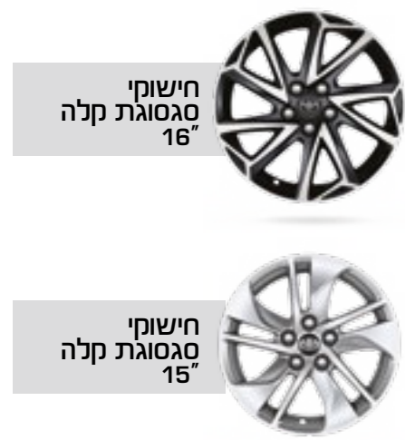
חישוקי סגסוגת קלה 16"