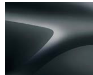
אפור מטאלי (KNA)