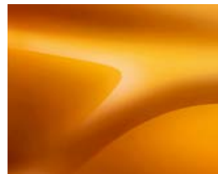
כתום מטאלי (EPY)