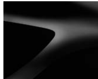
שחור פנינה מטאלי (676)