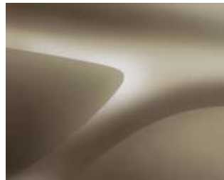
בז' מטאלי (HNP)

צבעים מטאליים תוספת בגין צבע מטאלי 1,200 ₪