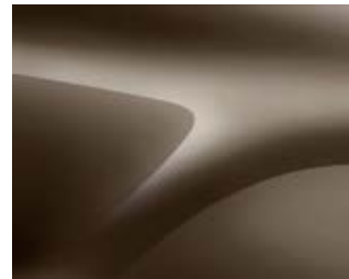
חום מטאלי (CNM)