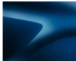
כחול מטאלי (RPR)