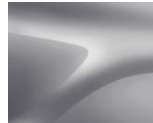
כסף מטאלי (D69)