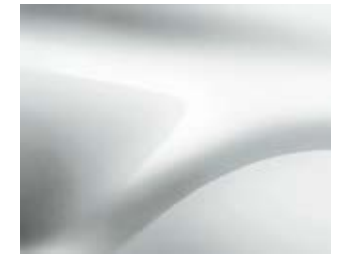
לבן קרח (369)