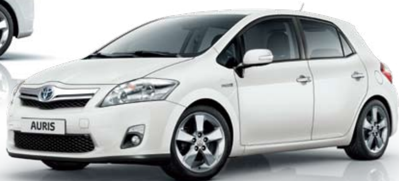
לבן פנינה מטאלי - 070