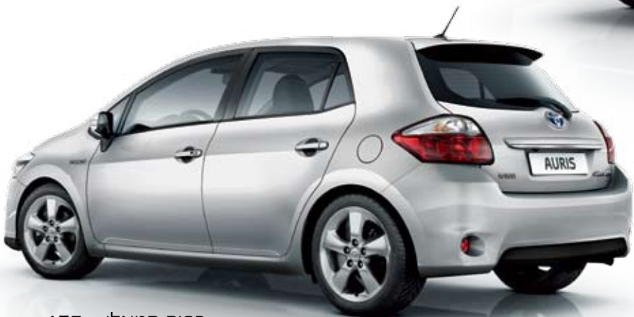
כסף מטאלי - 1F7