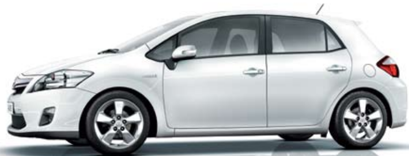
לבן - 040