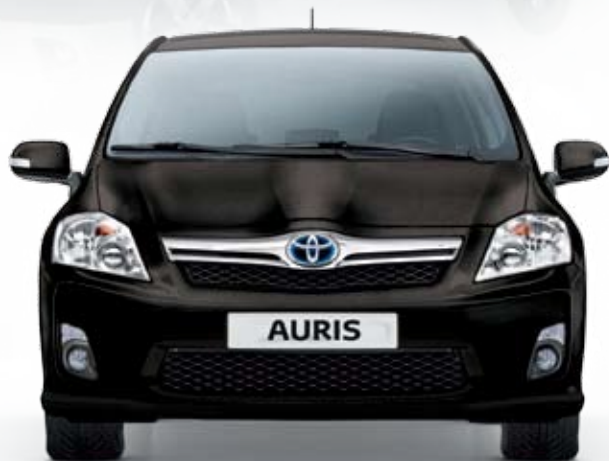
שחור מטאלי - 209