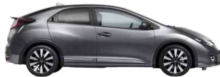
אורך כללי מ"מ 4370