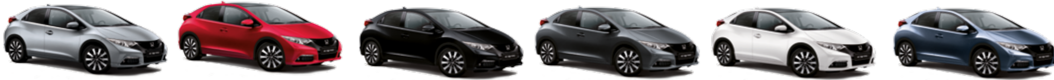
ALABASTER SILVER METALLIC