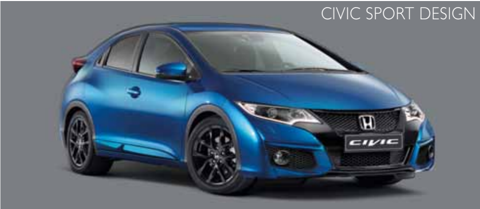
CIVIC SPORT DESIGN