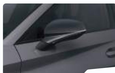
אפור גרפיט R6R6