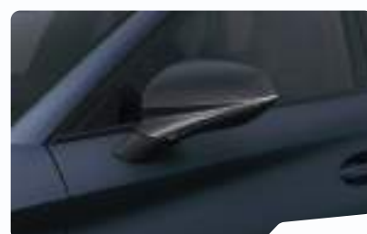
כחול מט Q4Q4