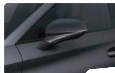
אפור מט 9R9R