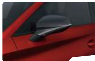
אדום כהה יין E1E1