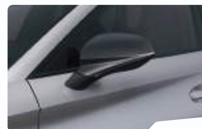
כסוף מטאלי L5L5