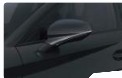
שחור מטאלי OE0E