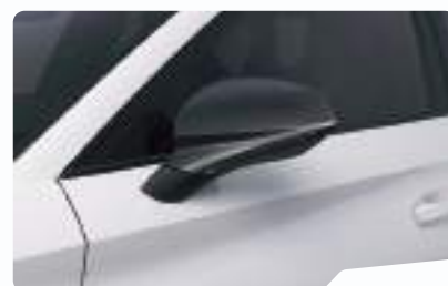
כבן נבדה 2Y2Y