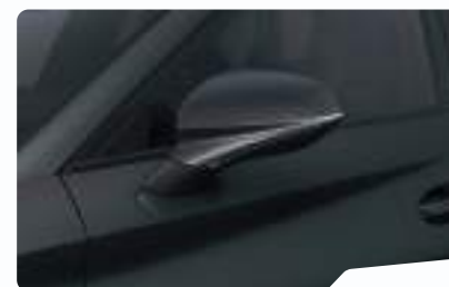
אפור מטאלי S7S7