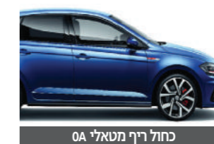
כחול ריף מטאלי 0A