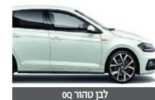
לבן טהור 0Q