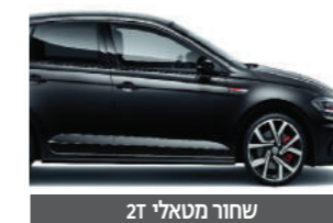
שחור מטאלי Z1