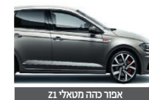
אפור כהה מטאלי Z1