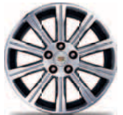
חישוקי 18" אלומיניום מוברש