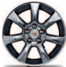
חישוקי 17" אלומיניום מוברש