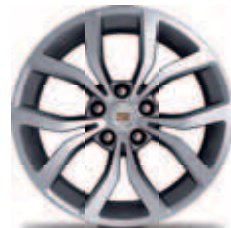
חישוקי 18" אלומיניום