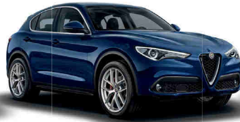
092 כחול מונטה קרלו