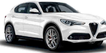
248 לבן טריו