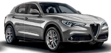
620 כסוף סילברסטון