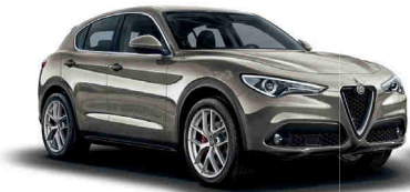
082 בז' טיטניום