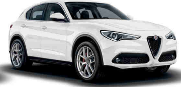
217 לבן אלפא