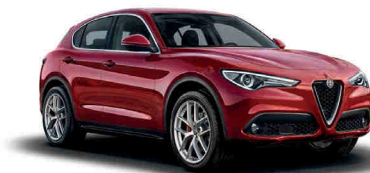
361 אדום 8C