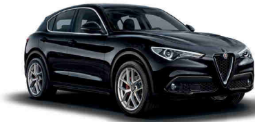
048 שחור וולקנו