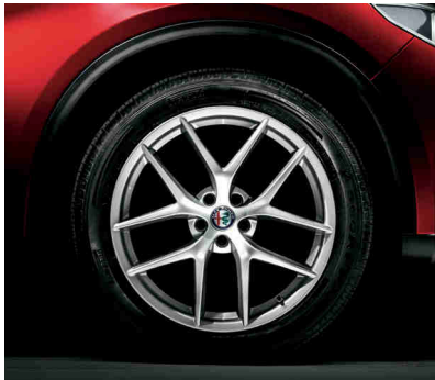
5A6 FIRST EDITION DESIGN