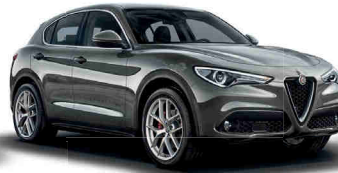
318 אפור מגנזיום