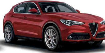
414 אדום אלפא