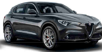
035 אפור מטאליקו