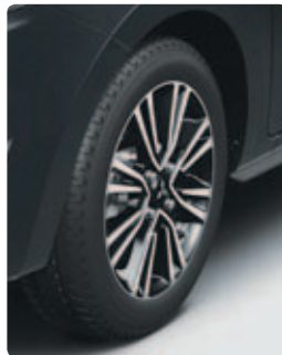
15" חישוקי סגסוגת קלה בדגם PREMIUM