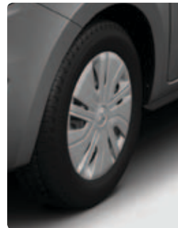
14" חישוקי פלדה בדגמי INVITE, INSTYLE