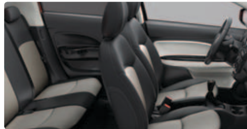
שחור בשילוב כז'