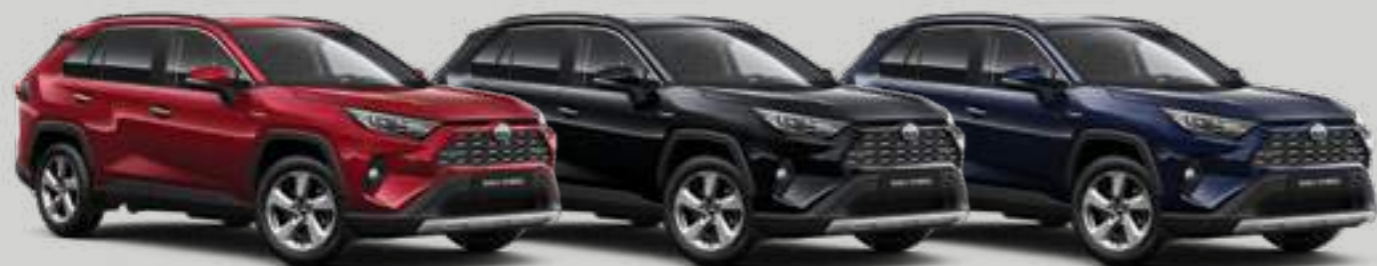
אדום רוז מטאלי 3T3