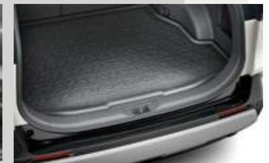
אמבטיה לתא המטען