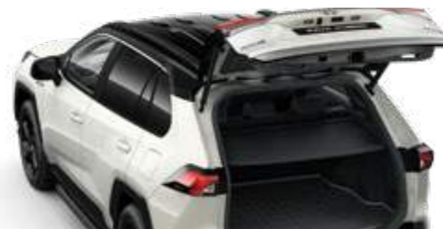
דלת תא מטען חשמלית*