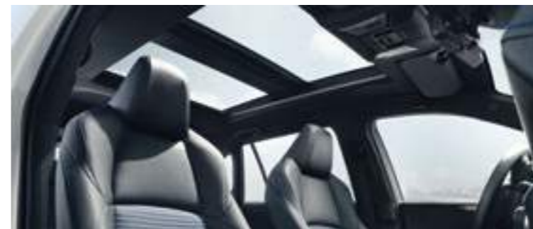
גג פנורמי (Panoramic roof)*