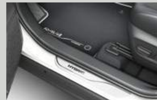
סט קישוטי סף לדלתות