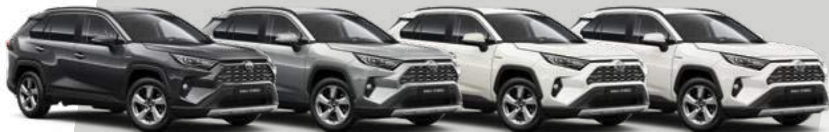
אפור כהה מטאלי 1G3