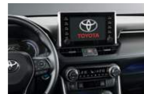
מערכת מולטימדיה 8" דוברת עברית