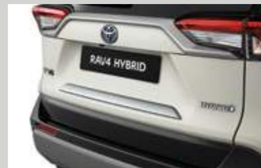
פס קישוט לתא המטען בצבע ניקל