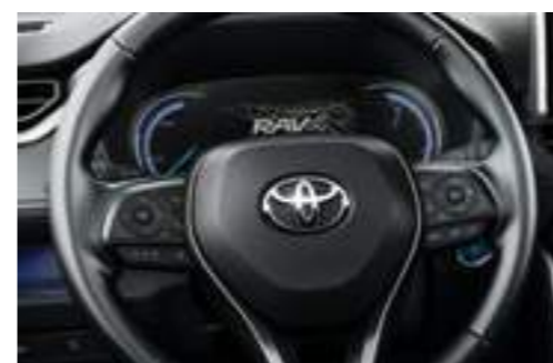
מסך נתונים צבעוני בלוח המחוונים "7"