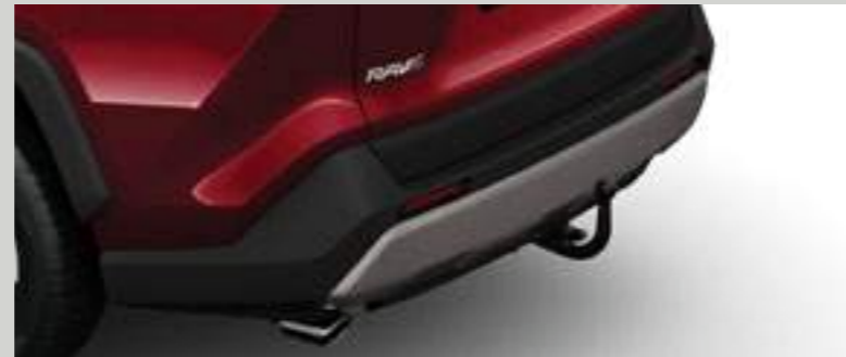
וו גרירה תפוח