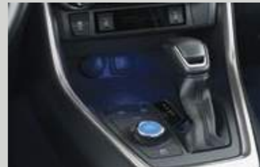
משטח טעינה אלחוטי לטלפון נייד*