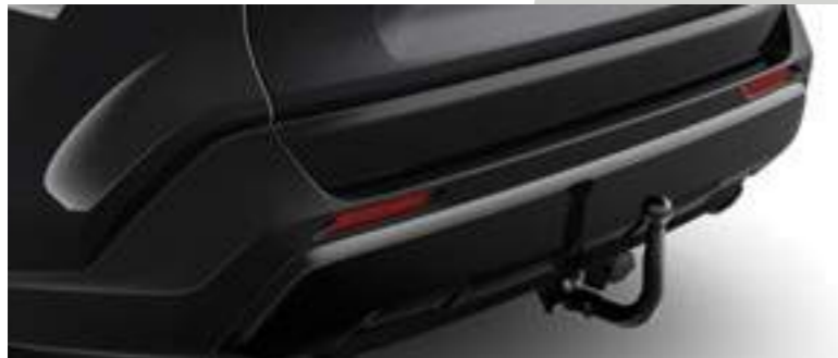
וו גרירה נשלף