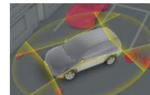
תצוגה פנורמית 360*