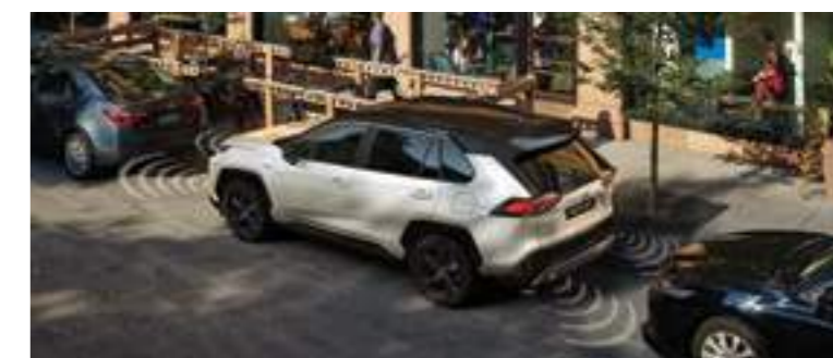
חיישני חניה אחוריים וקדמיים*