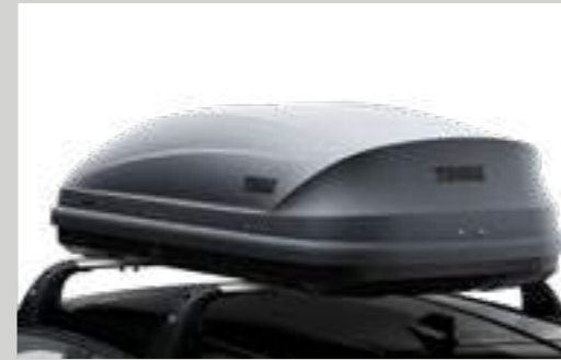
ארגז אחסון לגג הרכב