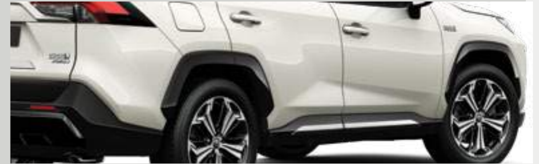
סט פסי קישוט לדלתות