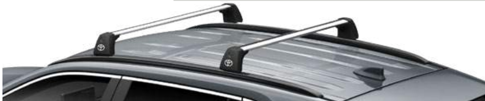
מוטות רוחב - לדגמים עם מוטות אורך בלבד