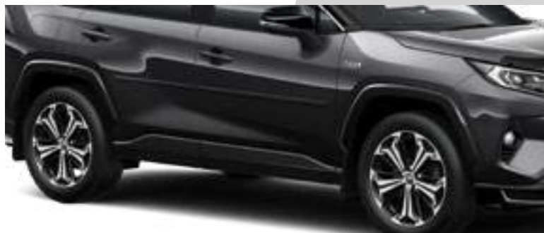
סט פסי הגנה לדלתות בצבע שחור ובצבע הרכב