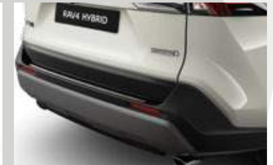
מגן שריטות לתא המטען