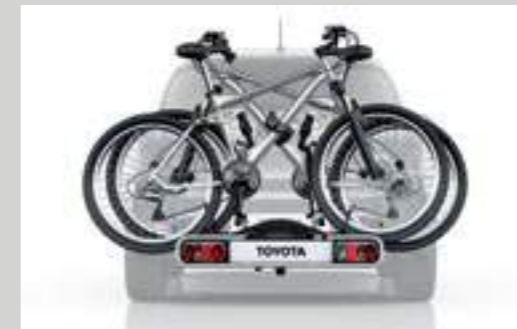
מתקן נשיאה לשני זוגות אופניים