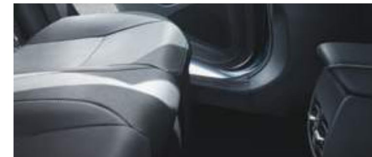
פתחי מיזוג אחוריים ליושבים במושב האחורי