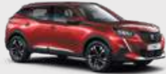
ELIXIR RED | VHM5 | אדום מטאלי