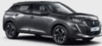
PLATINIUM GREY | VLM0 | אפור כהה מטאלי