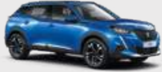
VERTIGO BLUE | SMM6 | כחול פנינה מטאלי