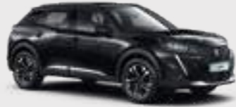
ONYX BLACK | XYPO | שחור מטאלי