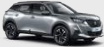
ARTENSE GREY | F4M0 | כסוף כהה מטאלי