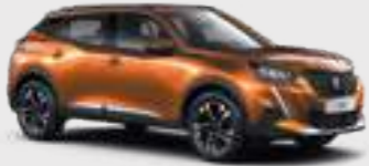
ORANGE FUSION | 2SM0 | כתום מטאלי