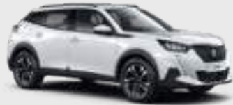
BANQUISE | WPP0 | לבן בנקיז

לרשותך עומד מגוון רחב של צבעים שיאפשר לך להביע את עצמך באופן מלא.