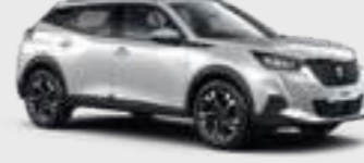
PEARLESCENT WHITE | N9M6 | לבן פנינה מטאלי