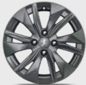
חישוקי סגסוגת "16" ELBORN בדגמי ACTIVE