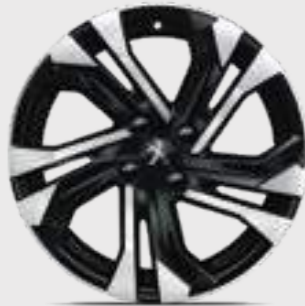
חישוקי סגסוגת "17" SALAMANCA בדגמי PREMIUM