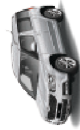
Brilliant Silver metallic - 8E