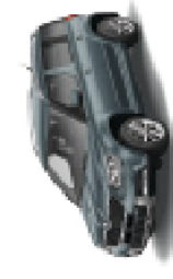
Metal grey metallic - F6