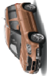
Terracota Orange uni - 0H