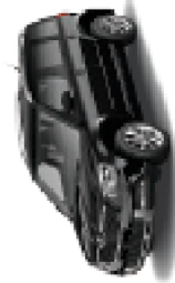
Black Magic pearl effect - 1Z