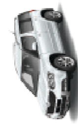
Moon white metallic - 2Y