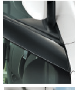
מחזיק כרטיס חניה