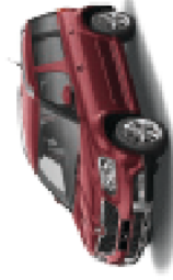
Rosso Brunello metallic - X7