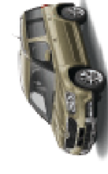
Jungle green metallic - L2