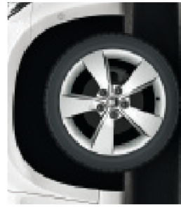
הישוקי סגסוגת מדרגם Erebus