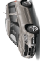
Cappuccino Beige metallic - 4K