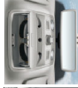
תא אחסון למשקפיי שמע (Elegance)