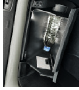
תא כפפות מקורר