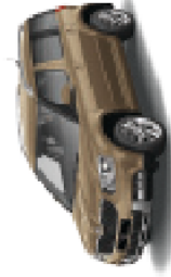
Mato Brown metallic - 1M