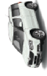
Laster white - j3