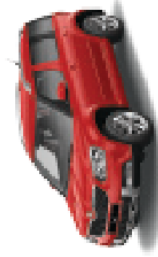
Corrida Red uni - 8T