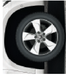
הישוקי סגסוגת מדרגם Nevis