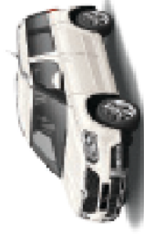
Candy White uni - 9P