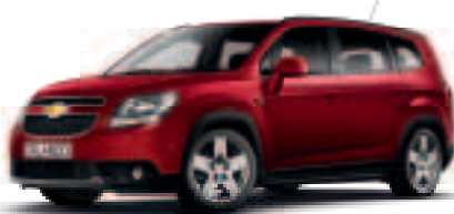
אדום קטיפה מטאלי