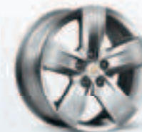
חישוקי אלומיניום 17" בדגם LT+