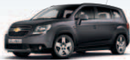
אפור פיטר מטאלי