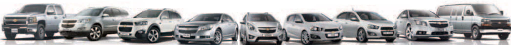
שברולט סילברדו 2500