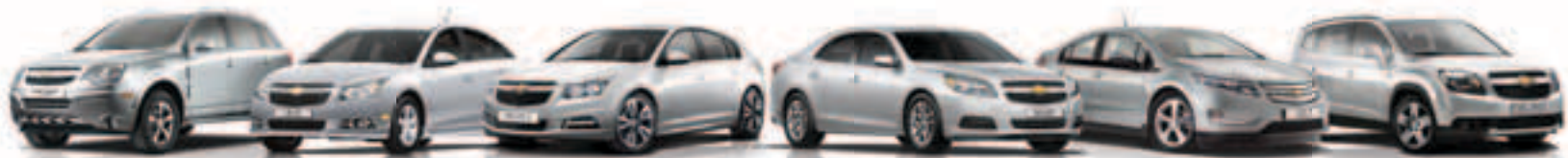
שברולט קפטיבה ספורט