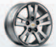
חישוקי אלומיניום 16" בדגם LT