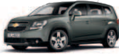
אפור עשן מטאלי