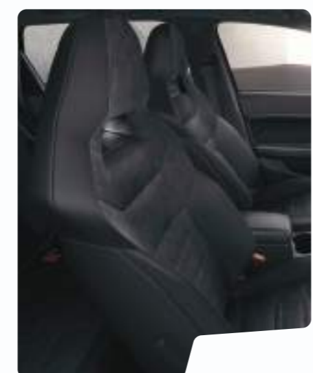
מושב באקט בד

* אפשרות החיבור בישראל תלויה ביצרניות מערכות ההפעלה. כמו כן, בחירת האפליקציה נעשית על ידן ואין באפשרות CUPRA באשר היא להשפיע על כך.