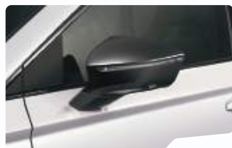
לבן נבדה 2Y2Y