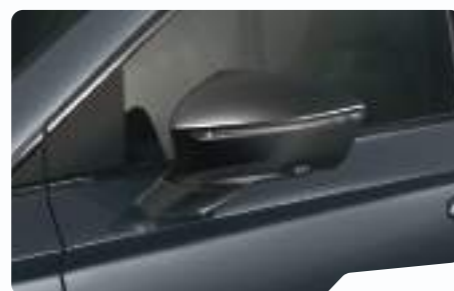
אפור מטאלי S7S7