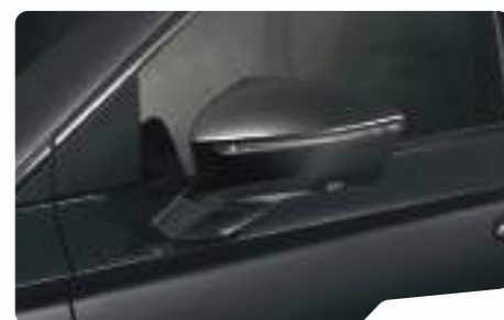
שחור פנינה 6J6J