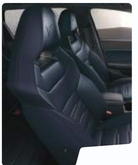
מושב באקט עור כחול