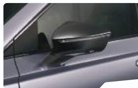
כסוף מטאלי L5L5