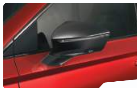
אדום כהה יין E1E1