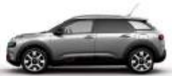
אפור פלדה מטאלי