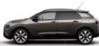
אפור פלטינום מטאלי