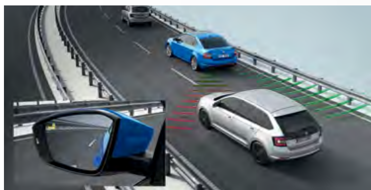
Blind Spot Detect מערכת לזיהוי כלי רכב ב-"שטח מת"