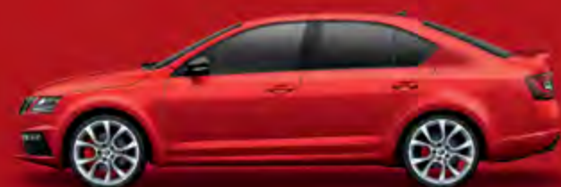
Corrida Red (8T8T)