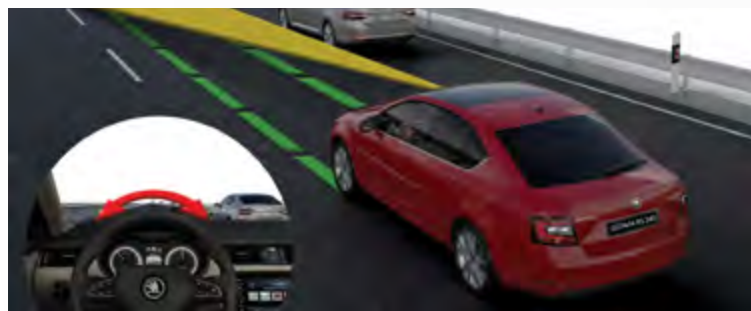
Lane Assist מערכת אקטיבית למניעת סטייה מנתיב

בסקודה מבינים שהבטיחות היא הדבר החשוב ביותר ולכן האוקטביה RS 245 מצוידת במגוון מערכות בטיחות אקטיביות ופסיביות השומרות על בטיחות הנוסעים ברכב.