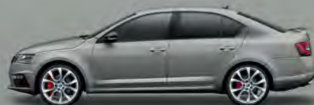
Steel Grey (M3M3)