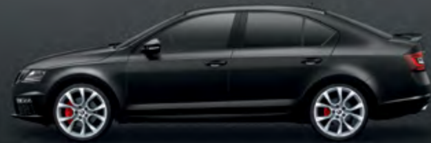
מטאלי Magic Black (1Z1Z)