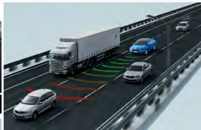
Adaptive Cruise Control בקרת שיוט אדפטיבית