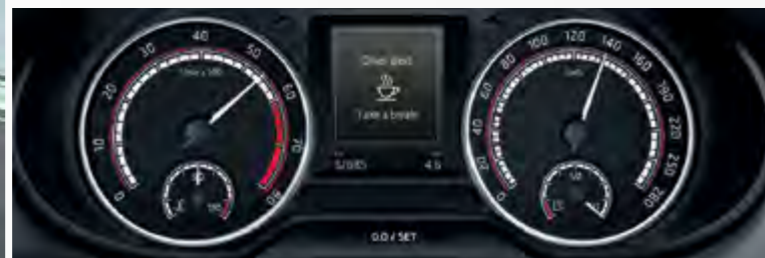
Driver Alert מערכת לזיהוי עייפות נהג