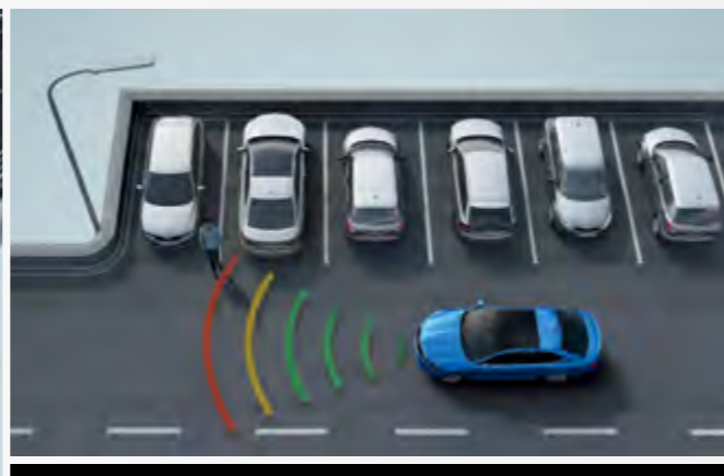
Front Assist with Emergency Braking מערכת אקטיבית לניטור מרחק מלפנים עם בלימה אוטומטית בחירום