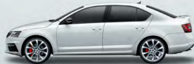
מטאלי Moon White (2Y2Y)