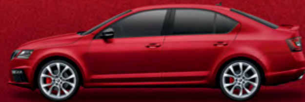
מטאלי Velvet Red (K1K1)