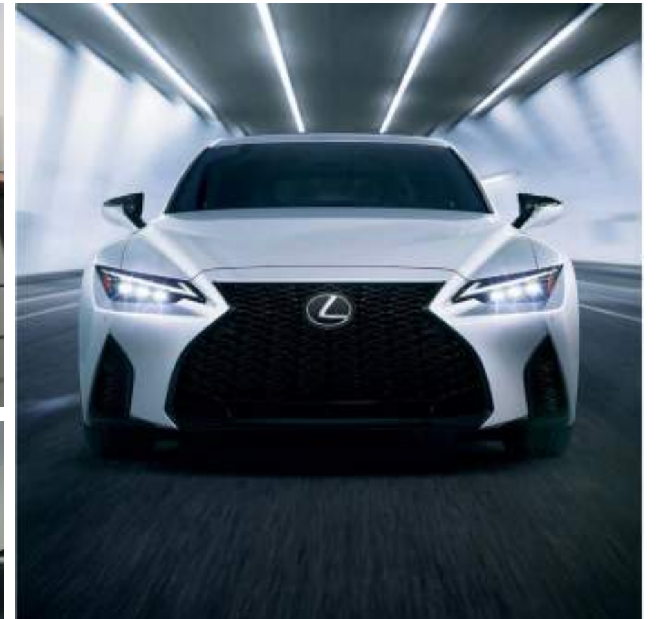
*התמונות להמחשה בלבד. ט.ל.ח.