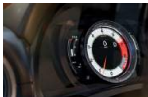
*התמונות להמחשה בלבד. ט.ל.ח.