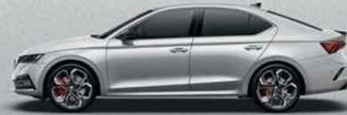
Brilliant Silver metallic