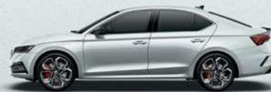
Moon White metallic