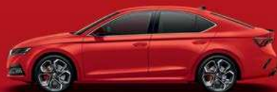
Corrida Red uni