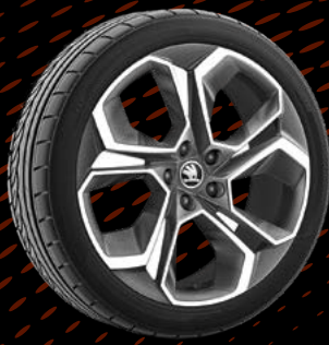
חישוקי סגסוגת RS בגודל 19"