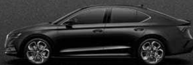
Magic Black metallic