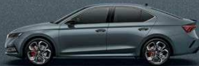
Quartz Grey metallic