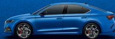
Race Blue metallic