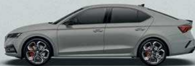
Steel Grey uni