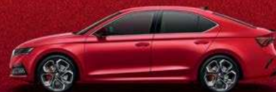
Velvet Red metallic