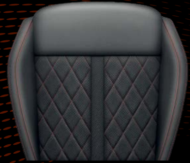
מושבי ספורט ארגונומיים עם ריפודי אלקנטרה / עור (בתוספת תשלום)