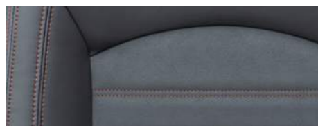
מושבי Grand Lux (R) עם תפרים אדומים*