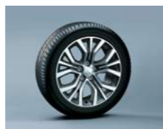
חישוקי סגסוגת 18"