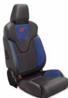
מושבי עור חלקי Protection on Lux עם חיפוי מושב Charcoal Black (שחור) וכריות צד Lux בצבע Performance Blue (כחול)