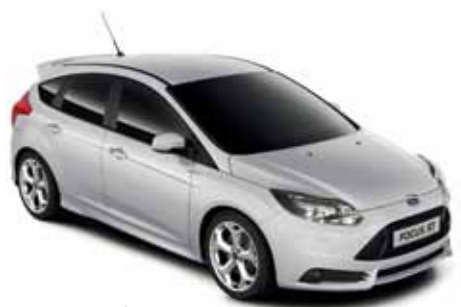
כסף מטאלי (A59)