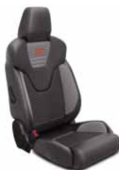
מושבי עור חלקי Protection on Lux עם חיפוי מושב Charcoal Black (שחור) וכריות צד Lux בצבע Charcoal Black (אפור)