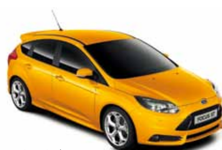
צהוב מטאלי* (A5G)