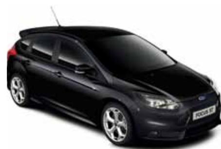
שחור מטאלי (A52)