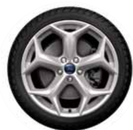
חישוקי סגסוגת 18 אינץ'