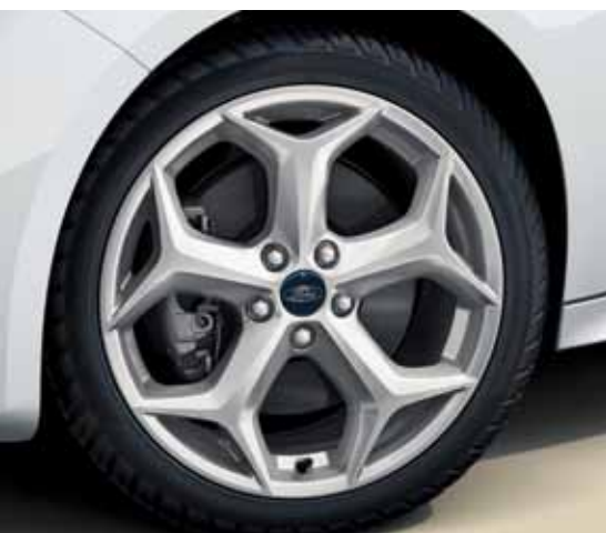
מתלה בעל כונון ספורטיבי