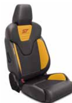
מושבי עור חלקי Protection on Lux עם חיפוי מושב Charcoal Black (שחור) וכריות צד Lux בצבע Electric Gold (צהוב)