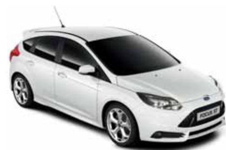
לבן קפוא (A51)