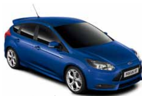
כחול ספיריט (A5A)