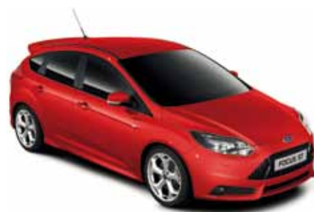
אדום מרוצים (A5J)